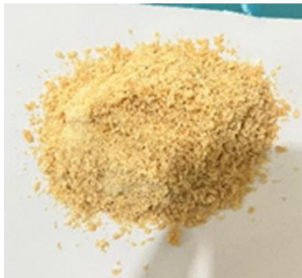
Gambar 1. Hasil Liofilisasi

menjaga struktur enzim yang sensitif terhadap panas dan mencegah penurunan aktivitas selama penyimpanan.