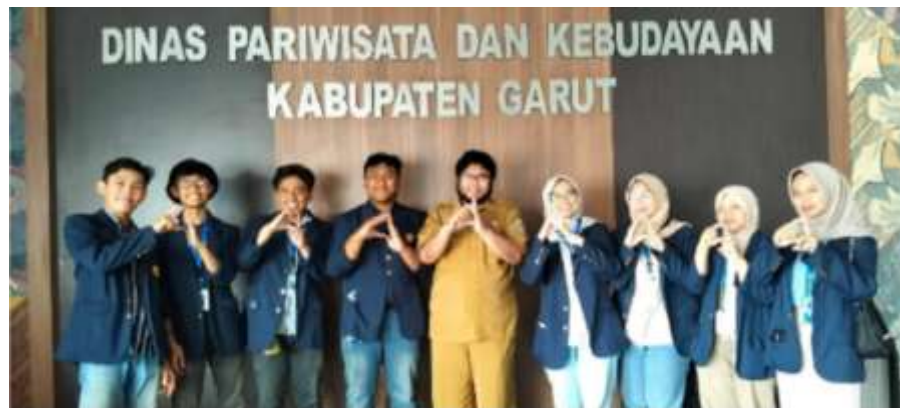
Gambar 4. Pengajuan Bolu Koja sebagai WBTb Jawa Barat kepada Dinas Pariwisata dan Kebudayaan Kabupaten Garut.

Penetapan WBTb Provinsi Jawa Barat Tahun 2026 yang diselenggarakan tanggal 29-31 Oktober 2025, diusulkan Bolu Koja dan Sambal Cibiuk untuk dilanjutkan sebagai WBTb Jawa Barat yang berasal dari Kabupaten Garut. Selain itu, pencatatan WBTb ini juga sekaligus mendorong inventarisasi dokumen kuliner khas Garut lainnya yaitu Burayot untuk dapat naik tingkat ke WBTb Nasional. 24