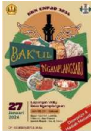
Gambar 2. Puncak kegiatan KKN tahun ke-2

Secara keseluruhan, kegiatan PPM ini memiliki harapan dampak yang signifikan. Dengan adanya materi visual yang menarik dan ringkas ini, diharapkan terjadi peningkatan pengetahuan dan pemahaman masyarakat, khususnya pelaku UMKM. Peningkatan literasi ini diharapkan dapat mendorong perubahan perilaku positif, baik dalam pengelolaan bisnis yang lebih profesional, perlindungan terhadap aset intelektual komunal, maupun kontribusi aktif dalam menjaga kebersihan lingkungan.