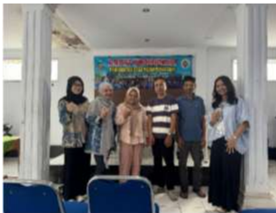
Gambar 3. Diskusi Terarah terkait Pengolahan Limbah Produksi Tahu dan Tempe Berkelanjutan.

Sasaran utama dari program ini adalah pengrajin tahu dan tempe yang ada di Desa Ngamplangsari. Program ini bertujuan untuk memberikan edukasi kepada perajin tahu dan tempe agar dapat mengolah limbah hasil produksinya menjadi produk yang bernilai ekonomi seperti pupuk sehingga tidak lagi mencemari lingkungan sekitar. Pada program KKN, mahasiswa dari Fakultas Pertanian berbagi pengalaman dengan perajin Tahu-Tempe dengan cara menetralkan limbah cair dengan menggunakan kapur pertanian dolomit. Limbah diolah menjadi pupuk cair organik (PCO) dengan menambahkan EM4 sebagai bakteri pengurai dan gula sebagai sumber makanan. Untuk menjaga keberlanjutan program, tim PPM berupaya untuk mempertemukan produsen tahu dan tempe dengan pihak pemerintah desa sehingga pupuk yang dihasilkan dapat bermanfaat setidaknya bagi tabulapot (tanaman buah dalam pot) di rumah warga.