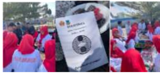
Gambar 1. Lomba membungkus dodol dan pembuatan booklet Manisnya, Kairut ku Kareut Dodol-Wajit