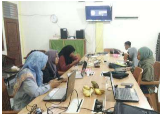
Gambar 2 Kegiatan Pendampingan di MI Ihyaul Ulum Dukun Gresik

Sebelum pelatihan, mayoritas guru memiliki pemahaman yang rendah mengenai penggunaan aplikasi digital untuk membuat media evaluasi. Hal ini terlihat dari hasil pre-test yang menunjukkan bahwa hanya sekitar 25% peserta yang memahami konsep dasar dan fungsi aplikasi Quizizz. Setelah pelatihan, hasil post-test menunjukkan peningkatan signifikan. Sebanyak 85% peserta mampu memahami fitur-fitur aplikasi Quizizz, seperti pembuatan kuis, pengaturan waktu, mode permainan, serta analisis hasil evaluasi. Guru juga menunjukkan kemampuan dalam membuat kuis interaktif yang sesuai dengan kebutuhan pembelajaran di kelas masing-masing. Setiap peserta berhasil membuat minimal satu kuis dengan soal yang bervariasi (pilihan ganda, isian singkat, dan lain-lain).