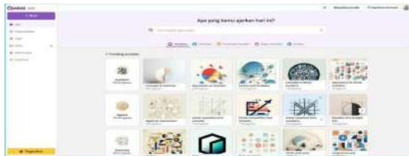
Gambar 1 Tampilan Beranda Quizizz