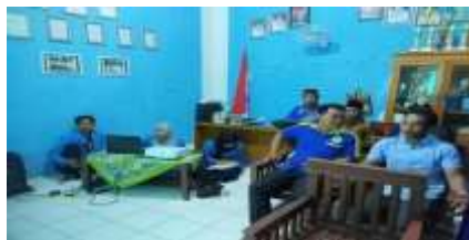
Gambar: Kegiatan Literasi Digital Pada Aparatur Pemerintah Desa Argosari, Kabupaten Sarolangun