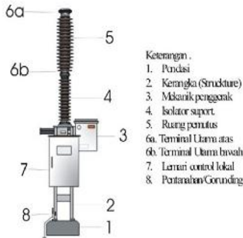
Gambar 2. Bagian bagian utama PMT

dispatcher maupun secara lokal oleh operator gardu induk sesuai kebutuhan operasi sistem tenaga Listrik [9]. Berdasarkan hasil observasi lapangan, PMT yang digunakan memiliki beberapa komponen utama yang mendukung proses pemutusan dan penyambungan arus listrik. Komponen tersebut meliputi ruang pemadam busur (interrupter chamber), tangki gas SF 6 , mekanisme penggerak (operating mechanism), terminal utama, dan sistem control [10]. Bagian-bagian utama PMT yang diamati selama penelitian ditunjukkan pada Gambar 2 .