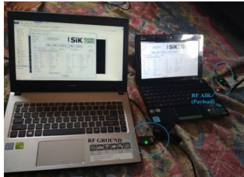
Gambar 3. Sinkronisasi antara modul transmitter dan receiver

Setelah men- setting modul transmitter (air) dan modul receiver (ground) , untuk melihat apakah modul transmitter (air) dan modul receiver (ground) sudah terhubung atau tidak dapat di lihat dari lampu LED pada radio tidak berkedip yang terlihat pada Gambar 3.