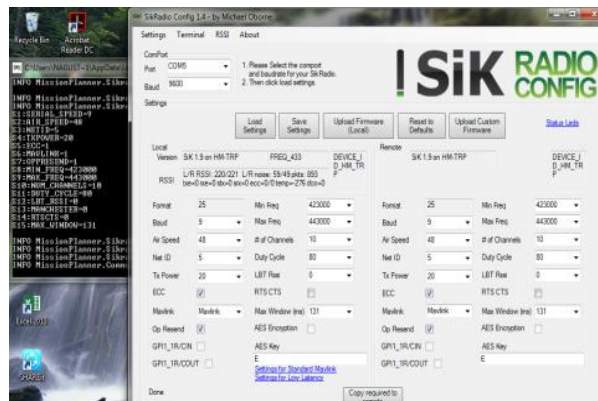
Gambar 2. Modul 3DR telah disetting

Pada modul 3DR Radio Telemetry perlu dilakukan sinkronisasi terlebih dahulu antara modul transmitter (air) dan modul receiver (ground) dengan cara menyamakan kedua setting yang meliputi Baudrate , Air Speed , Net Id dan Tx Power .