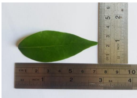
Gambar 1. Makroskopik daun dewandaru

Bahan yang digunakan yaitu daun dewandaru yang diperoleh dari Kadungora Kabupaten Garut, Jawa Barat. Berdasarkan hasil determinasi diketahui bahwa tumbuhan uji merupakan daun dewandaru dengan nama latin Eugenia uniflora L. Makroskopik daun dewandaru dapat dilihat pada Gambar 1 dan Tabel 1.