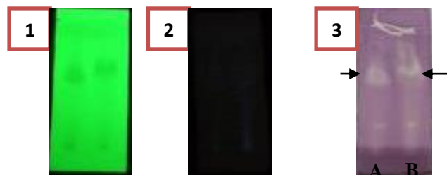
Gambar 1. Pola kromatografi ekstrak daging dan usus teripang gamat Stichopus variegatus A: Ekstrak daging; B: Estrak usus; 1: dibawah lampu UV 256 nm; 2: dibawah lampu UV 356nm; 3: Visual dengan Penampak Bercak DPPH 0,2 %

Pengujian kualitatif antioksidan dengan metode kromatografi lapis tipis dengan pengembang yang digunakan adalah kloroform:etanol (9:1) dan fase diam yang digunakan adalah silika gel F 254 . Berdasarkan hasil pemantauan yang dilakukan terdapat spot berwarna kuning dengan latar ungu yang tampak setelah disemprot dengan penampak bercak DPPH 0,2% dalam metanol, pembentukan 1,1-difenil-2-pikrilhidrazin (bercak ungu) tersebut menandakan adanya senyawa antioksidan.