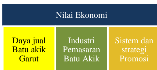
Gambar 1 : Dimensi nilai ekonomi

Faktor- faktor yang menjadi kajian dalam penelitian ini adalah sebagai berikut: