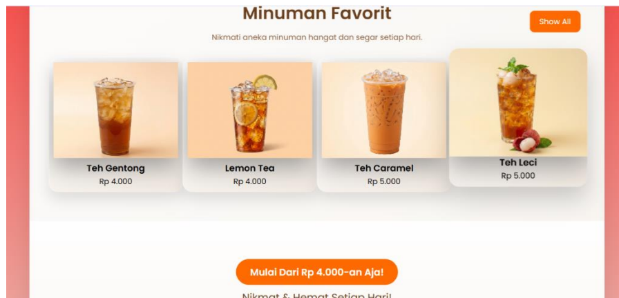
Gambar 3. Tampilan Halaman Menu Produk

Pada bagian menu, website menampilkan daftar produk seperti teh gentong, lemon tea, teh caramel, dan teh leci lengkap dengan harga. Informasi disajikan dalam bentuk kartu produk sehingga memudahkan pengguna dalam melihat dan memilih menu. Penyajian ini menunjukkan bahwa website mampu menggantikan menu konvensional menjadi lebih interaktif dan informatif.