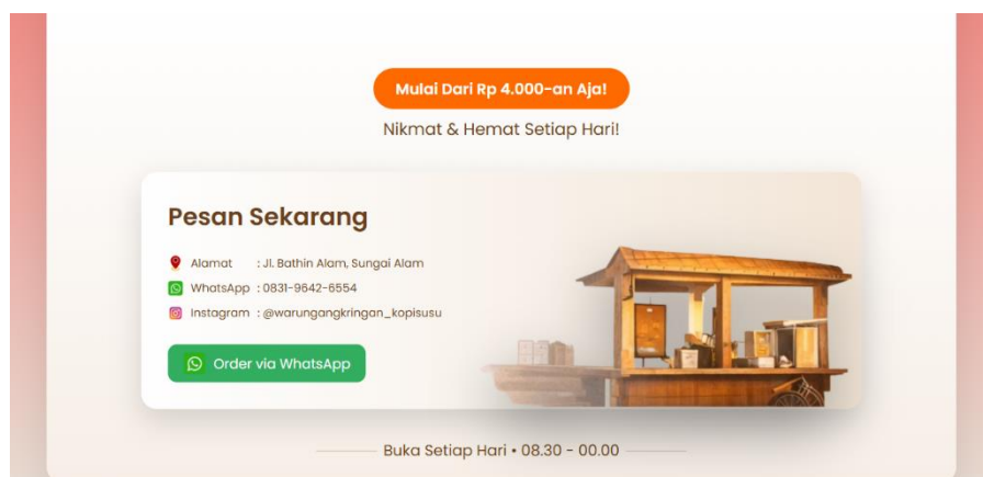
Gambar 4. Tampilan Halaman Kontak dan Pemesanan

Pada bagian kontak, website menyediakan informasi alamat, nomor WhatsApp, serta akun Instagram. Terdapat tombol pemesanan langsung melalui WhatsApp yang memudahkan konsumen melakukan transaksi. Fitur ini menunjukkan bahwa website tidak hanya sebagai media informasi, tetapi juga sebagai sarana komunikasi dan pemesanan.