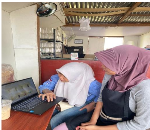
Gambar 5 Demonstrasi Website Kepada Pelaku UMKM

Pada tahap implementasi, tim pengabdian melakukan penyajian atau demonstrasi website yang telah dikembangkan kepada pemilik Warung Angkringan. Kegiatan ini bertujuan untuk mengenalkan fitur-fitur website, seperti halaman beranda, katalog produk, serta fitur kontak pemesanan yang terintegrasi dengan WhatsApp. Selain itu, dilakukan pendampingan secara langsung kepada pelaku UMKM agar dapat memahami cara mengoperasikan dan memanfaatkan website sebagai media promosi digital. Melalui kegiatan ini, pelaku usaha dapat memberikan masukan terkait tampilan dan informasi yang disajikan sehingga website yang dihasilkan sesuai dengan kebutuhan usaha.