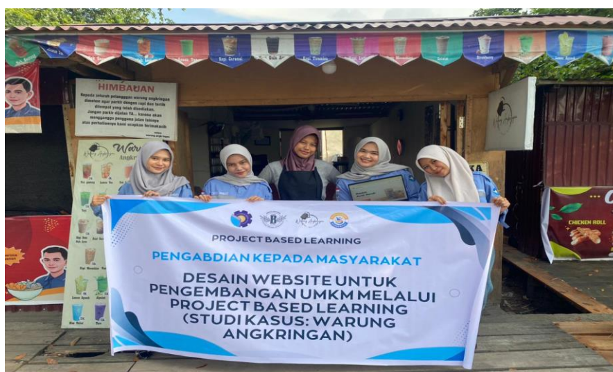
Gambar 6 Dokumentasi Kegiatan Pengabdian Kepada Masyarakat

Pada tahap implementasi, tim pengabdian melakukan penyajian atau demonstrasi website yang telah dikembangkan kepada pemilik Warung Angkringan. Kegiatan ini bertujuan untuk mengenalkan fitur-fitur website, seperti halaman beranda, katalog produk, serta fitur kontak pemesanan yang terintegrasi dengan WhatsApp. Selain itu, dilakukan pendampingan secara langsung kepada pelaku UMKM agar dapat memahami cara mengoperasikan dan memanfaatkan website sebagai media promosi digital. Melalui kegiatan ini, pelaku usaha dapat memberikan masukan terkait tampilan dan informasi yang disajikan sehingga website yang dihasilkan sesuai dengan kebutuhan usaha.