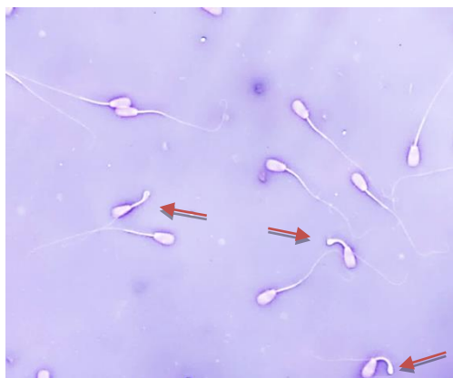
Gambar 1. Abnormalitas spermatozoa yang diamati menggunakan mikroskop perbesaran 40x. Tanda panah menunjukkan abnormalitas pada bagian tengah ( distal mid-piece reflex ).