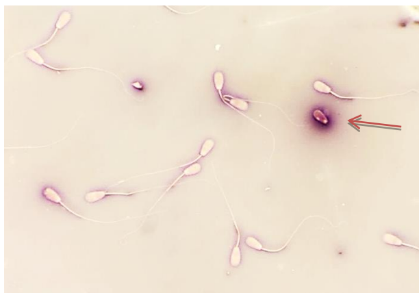
Gambar 2. Hasil pengamatan viabilitas spermatozoa menggunakan mikroskop perbesaran 40x. Tanda panah menunjukkan spermatozoa menyerap warna.

Peningkatan konsentrasi laktosa hingga 0.8% menurunkan viabilitas spermatozoa sapi peranakan Simmental setelah ekuilibrisasi. Konsentrasi laktosa yang terlalu tinggi cenderung merugikan spermatozoa selama penyimpanan. Hal ini juga terlihat pada laporan sebelumnya bahwa peningkatan level laktosa dalam pengencer meningkatkan osmolaritas dan menurunkan motilitas dan integritas membran spermatozoa unta Baktrian (Niasari-Naslaji et al. , 2006) dan peningkatan konsentrasi laktosa 30 mM-90 mM menurunkan viabilitas spermatozoa kambing Saanen (Tambing et al. , 2003).